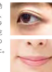
第三者機関が 効果を証明!

Yes 第三者機関による効能評価試験の結果、化粧品機能法ガイドライン評価に基づき、乾燥による小じわへの効果が確認されました。