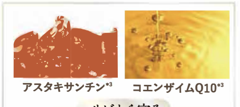
アスタキサンチン *3