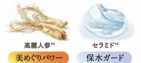
高麗人参 *3 美めぐりパワー