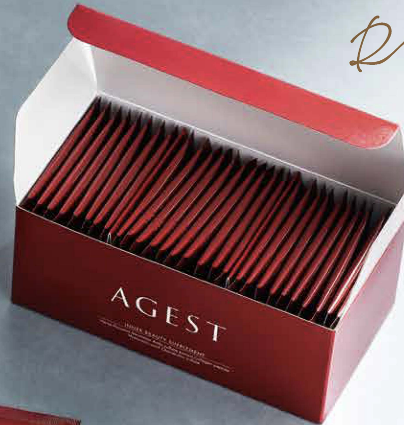
エイジスト インナービューティー サプリメント 1箱30包 [1ヵ月分]

馬プラセンタエキス末、サメ軟骨エキス末(サメ軟骨、チキストリン)、ムコ多糖タンパク複合体(デルマトン硫酸含有)、亜鉛含有酵母、ヒアルロン酸、ガラクトオリゴ糖、難消化性デキストリン、オクタニルジシロキシエチル、コエンザイムQ10、ナイアシン、ビタミンC、セサミン含有)、ノコギリセリ、ローズ、グリシン、L-プロリン、L-グルタミン、ステアリン酸Ca、パントテン酸Ca、L-シスチン、V.B1、V.B2、V.B6、セラック、ヘマトコッカス色素(アスタキサンチン含有)、葉酸、カルナワバロウ、V.B12(一部に乳糖成分 緑内障を含む)